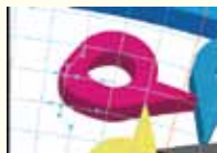
変形後にグリッドを操作し部分修正が可能です