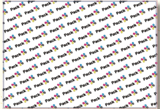
自動計算してパターン図案をエンドレス配置